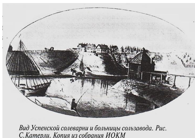
Рисунки из фондов Иркутского областного краеведческого музея

Аскарова, Лидия. Рисунки Станислава Катерли / Лидия Аскарова // Земля Иркутская. – 2000. - № 13. – С. 34-35, [2] с. : рис. – Усолъе-Сибирское – город исторический.