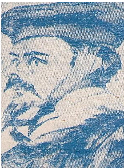
Николай Гаврилович Чернышевский в ссылке. Село Усолъе 1

В биографии Н. Г. Чернышевского Сибирь оставила глубокий след. Более семи лет провёл он на каторжных работах в Нерчинских рудниках, а затем 12 лет в Вилуйской ссылке.