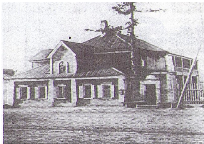
Дом коменданта сользавода села Усолъе, в котором останавливался Н. Г. Чернышевский