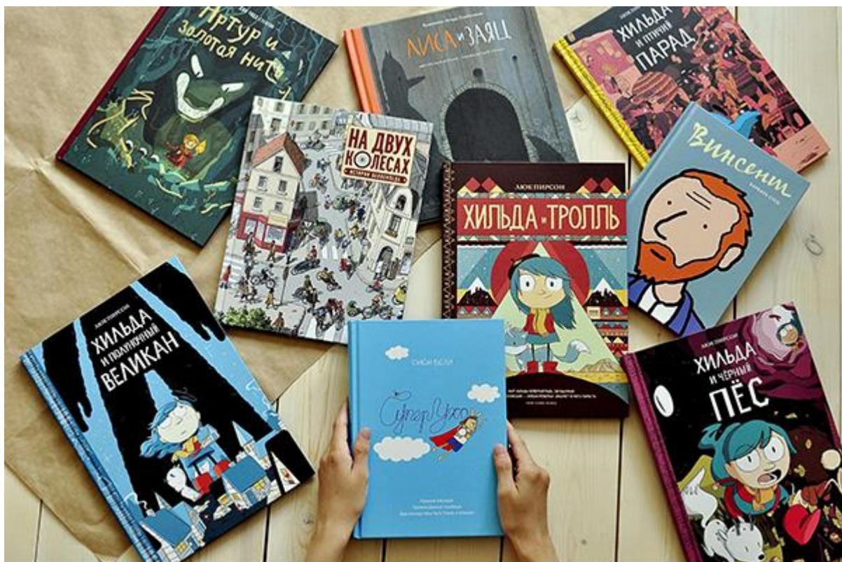
Комиксы бывают очень разные

Ребенок может ответить односложно. О животных. О сыщиках. О рыцарях. Если чувствуете, то разговор художественно начинается, можно попробовать развить тему: «И кто твой любимый герой?/И о чем твой любимый комикс?».