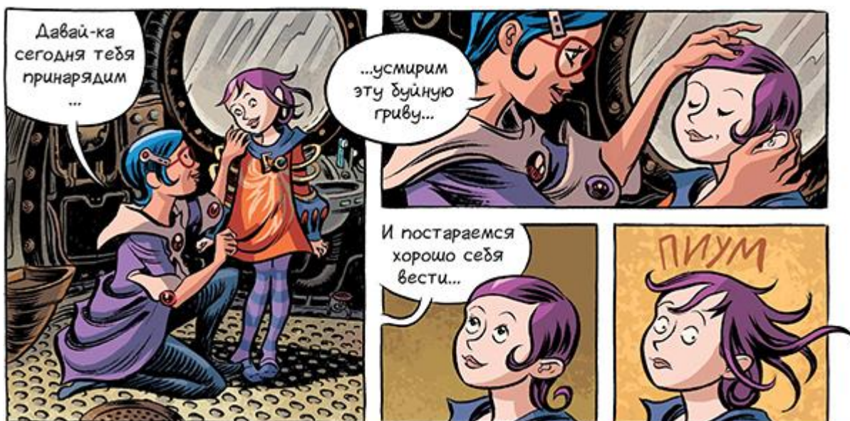
Иллюстрация из комикса «Космические лепешки» .

Заливаться хохотом необязательно, особенно, если не хочется. Достаточно просто хмыкнуть. Главное — от души.