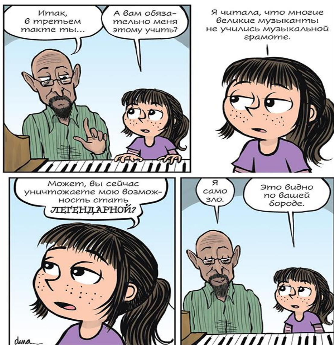
Иллюстрация из комикса «Фиби и единорог» .

Или многоточие? И наша попытка постучаться в закрытую дверь?