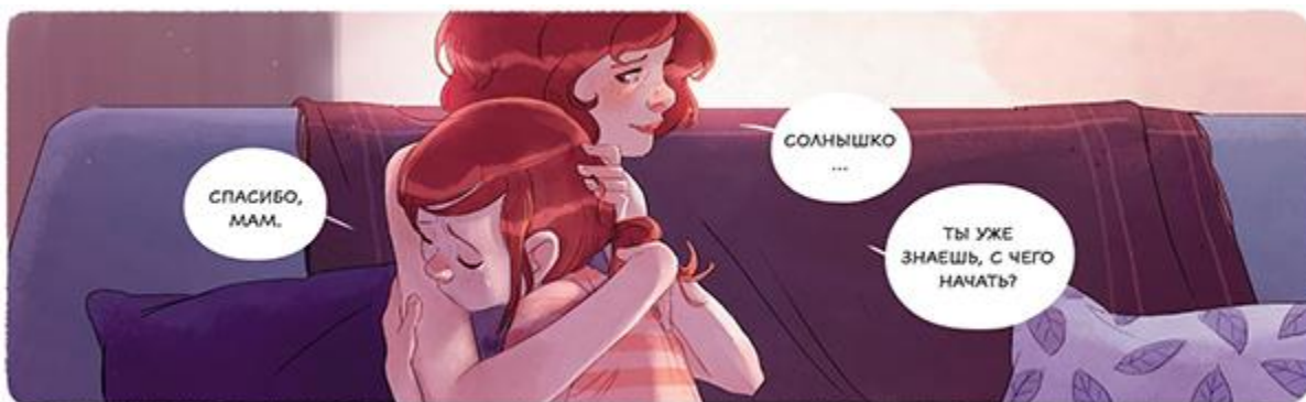
Иллюстрация из комикса «Дневники Вишенки. Том 4. Богиня без лица» .

Пять вопросов выше могут быть только началом. Началом большого разговора — мостика доверия между взрослым и ребенком. Как я люблю, когда размышления о чтении выходят за пределы освоения конкретной книги, а становятся частью отношений в семье! Я думаю, что разговор о комиксах способен укрепить и углубить эти отношения.