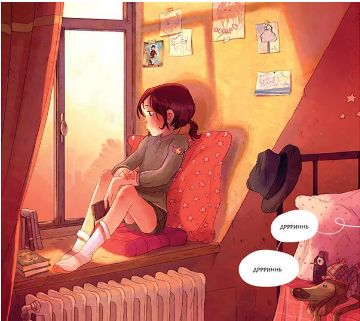
Иллюстрация из комикса «Дневники Вишенки. Том 2. Таинственная книга» .