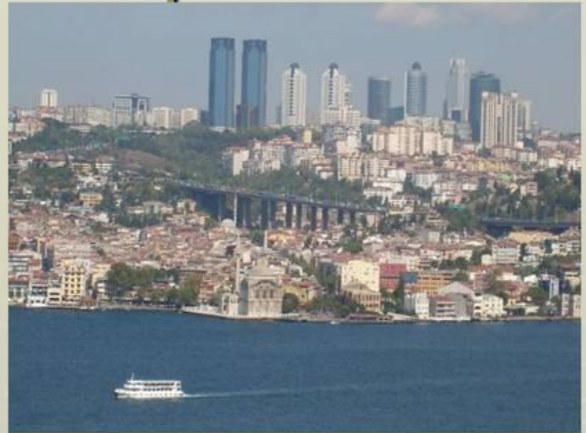
Стамбул, самый густонаселённый город

Распределение жителей по территории Турции крайне неравномерно. Наиболее густо заселены побережья Мраморного и Чёрного морей, а также районы, прилегающие к Эгейскому морю. Самый густонаселённый город — Стамбул и самый малонаселённый район — Хаккяри.