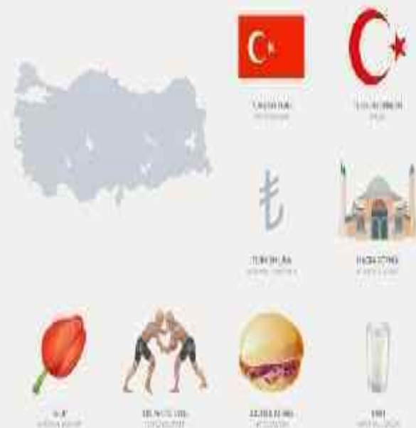
Nations: Symbols of Turkey

Таким образом, здесь смешались обычаи разнообразных стран и национальностей, слившись воедино-турецкую культуру. В Турции чтут все традиции и с размахом отмечают национальные праздники.