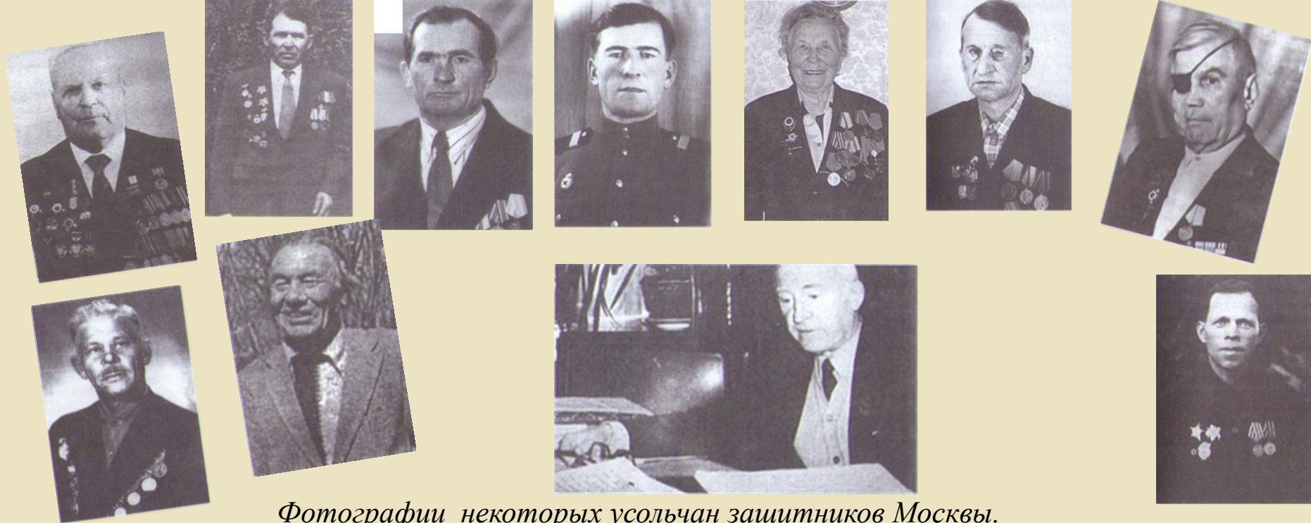
Фотографии некоторых усольчан защитников Москвы.