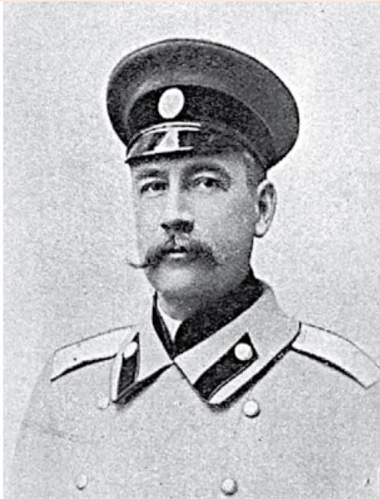
Генерал-лейтенант В.Е. Флуг

Так началось выполнение плана командарма Флуга: сковать противника фронтальным ударом 2-го Кавказского корпуса (генерал-адъютант П.И. Мищенко) и 22-го армейского корпуса (генерал от инфантерии А.Ф. фон-дер Бринкен), и перехватить отступавшие германские войска ударом 3-го Сибирского и 1-го Туркестанского корпусов на Августов – Лык.