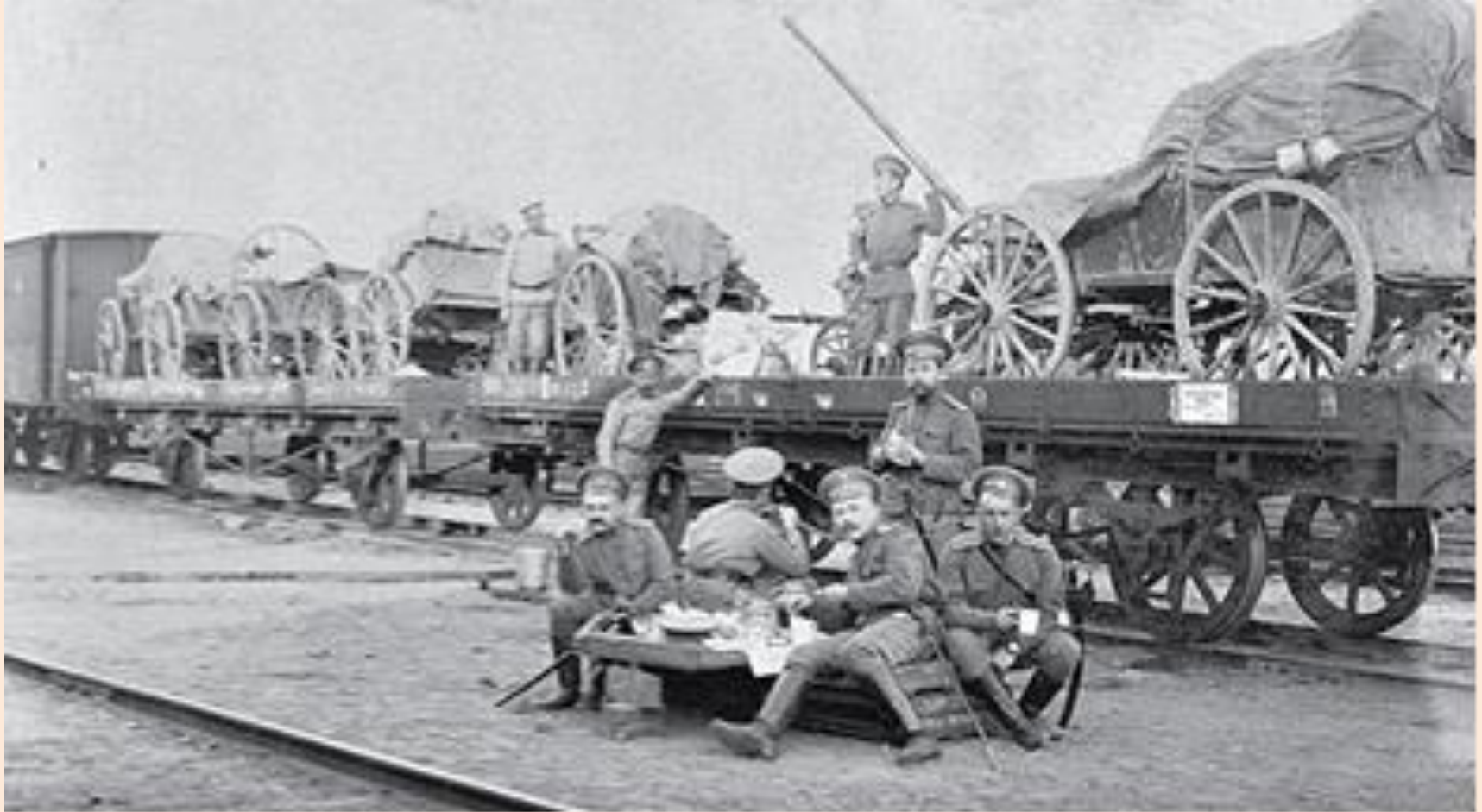
На войну! Сибирские стрелки в дороге.

Телеграмма о мобилизации была получена в штабе 3-го Сибирского армейского корпуса 18 июля в 2 часа ночи. Первый день мобилизации - 18 июля.