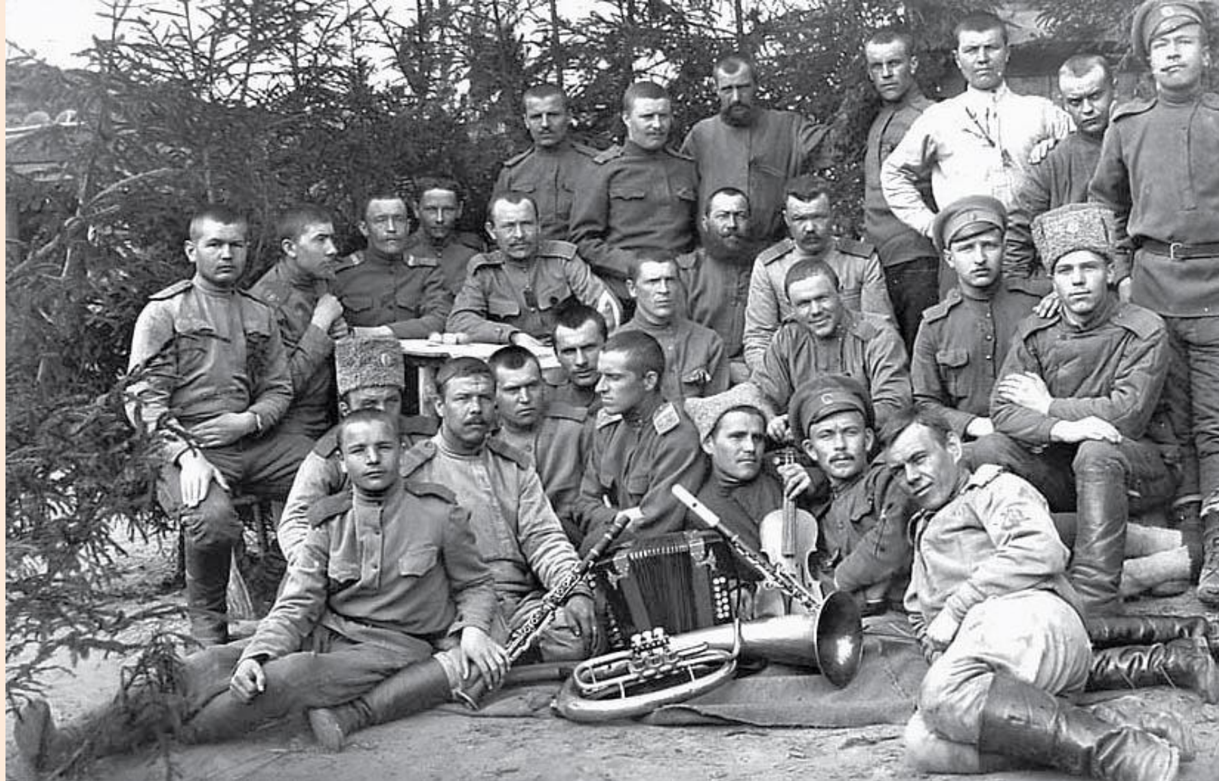
Писарская команда 28-го Сибирского стрелкового полка