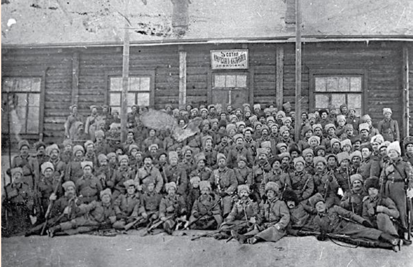
Казачи 3-й сотни Иркутского казачьего дивизиона. МБУК МИГИ

На фронтах Первой мировой войны воевало до 370 тыс. казаков или 7,6 % от всего казачьего населения России.