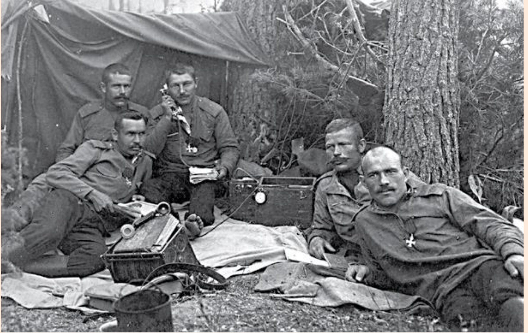
Георгиевские кавалеры 28-го Сибирского стрелкового полка