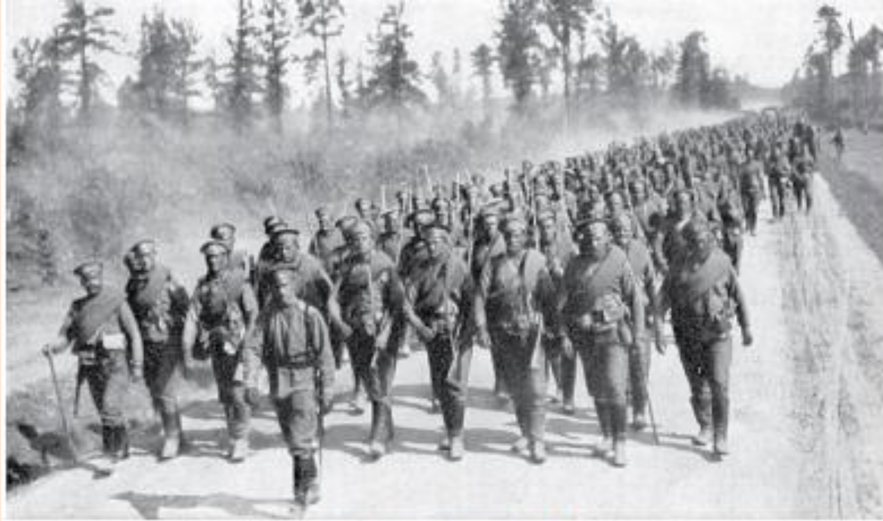
Русская пехота на марше

16 сентября части 3-го Сибирского корпуса оставались в Августове и его окрестностях и занимались укреплением позиций. 17 сентября получена шифрованная телеграмма штаба армии с приказанием – выступить из Августова на Сувалки для действий против сообщений противника, начавшего общее отступление из Сувалкской губернии.