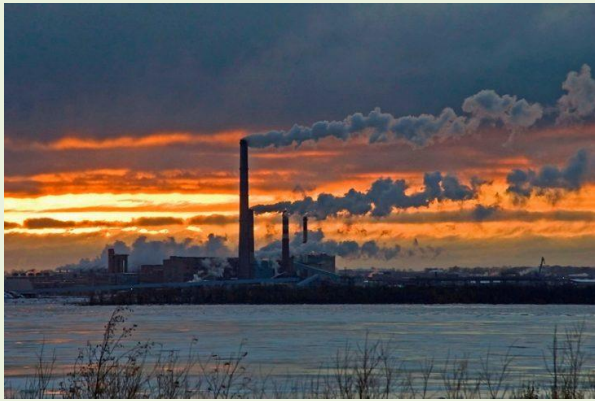
гидротехнические сооружения и Байкальский целлюлозно-бумажный комбинат, которые загрязняют акваторию озера;