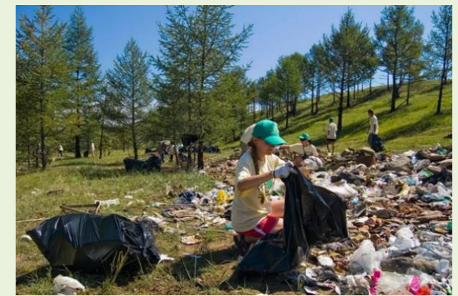
мусор от безнадзорного туризма;