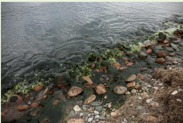
канализационные стоки от населенных пунктов, и незаконные сбросы предприятий;