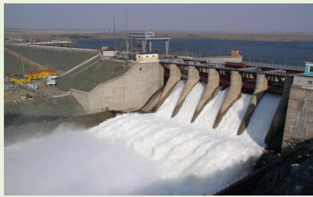
негативное влияние Иркутской и строящейся в Монголии ГЭС на уровень воды в озере;

Это уникальное озеро, но, как и у любого природного объекта, у него есть свои экологические проблемы: