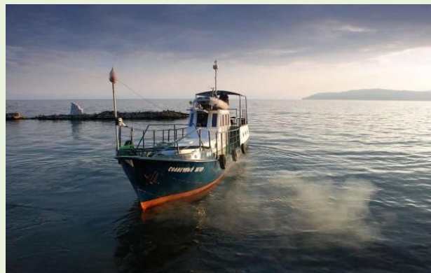
отходы топлива от водного транспорта;