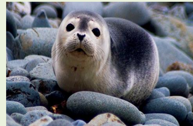
браконьерство на отлов нерпы – символа Байкала.