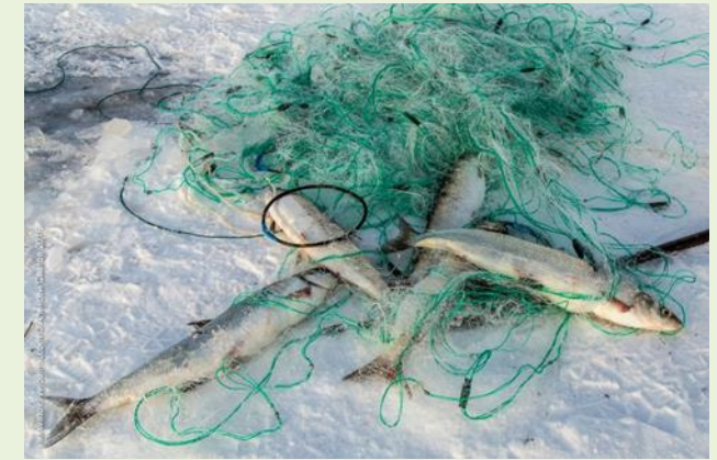
бесконтрольный рыбный промысел;