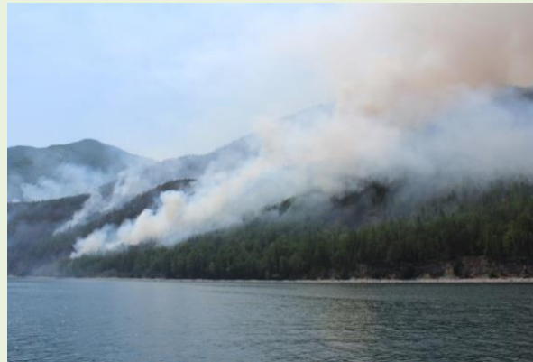
пожары и вырубка леса;