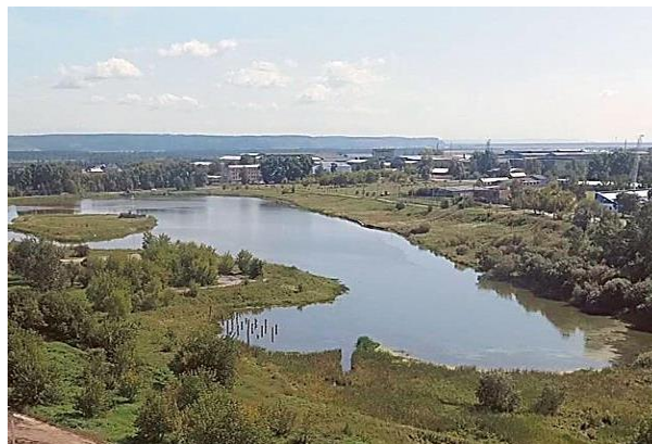
Иркутская область, г. Усолье Сибирское. Вся соль Сибири: «Озеро Молодежное», связывающее поколения

Автор барельефов - скульптор Михаил Середкин. Исторические справки - усольский краевед Сергей Васильевич Шаманский.