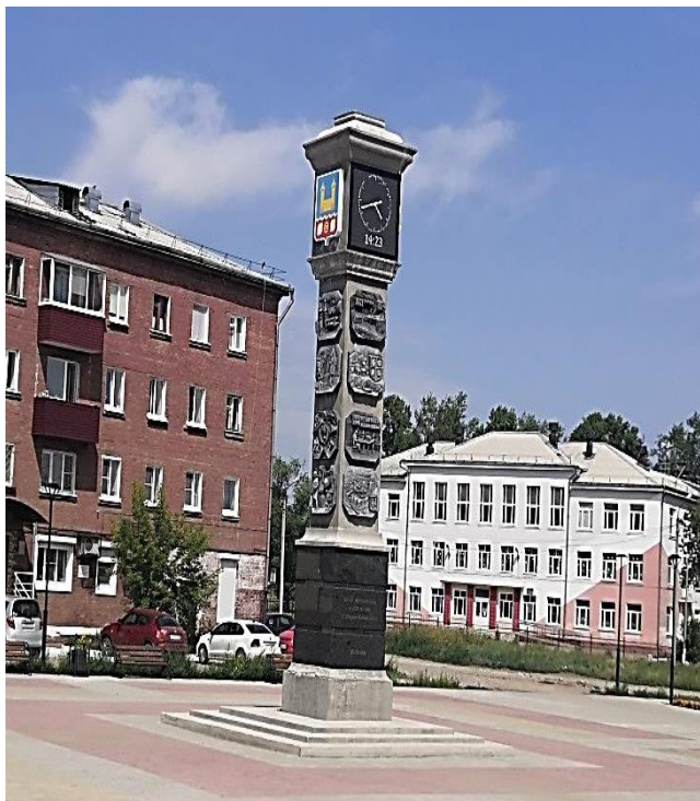
Иркутская область, г. Усолье Сибирское. Стела юбилейная «Усольский Биг-Бен»

Одним из самых заметных объектов в городе, на Комсомольском проспекте - сквер на территории 59-го квартала с тематической стелой в центре. Главная изюминка объекта – 16 барельефов, рассказывающих о событиях истории города в разные годы.