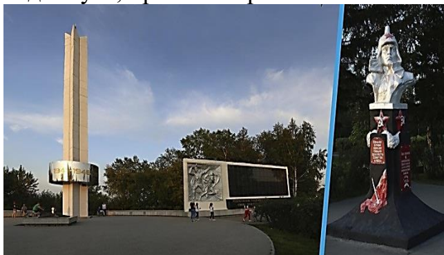
Иркутская область, г. Усолье Сибирское. Мемориальный комплекс

Озеро «Молодежное» открыто в 1977 году к 60-летию Великой Октябрьской революции. В 2021 году, территория вокруг озера была благоустроена. Одной из главных задач было сохранить природный ландшафт, раскрыть потенциал территории, где жители и гости города смогут отдохнуть, провести время с семьей.