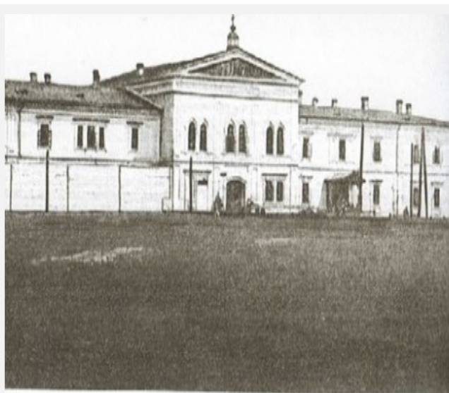
Иркутский тюремный замок — последнее земное пристанище Колчака. Открытка начала XX века

В 2006 году состоялось открытие музея истории Иркутского тюремного замка с мемориальной камерой Колчака А.В.. За время работы музей Иркутского тюремного замка стал одним из ключевых туристических мест Иркутска.